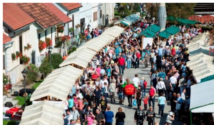
Sejemske stojnice na trgu v Podsredi

V letu 2017 je praznik privabil 16.000 obiskovalcev. Na dvodnevem sejmu regionalnih proizvodov se je predstavilo preko 170 razstavljalcev. Na sejmu se tradicionalno predstavljajo tudi društva in različne strokovne službe, ki delujejo v kozjanskem prostoru, ter množica glasbenih skupin, ki s kulturnim programom prispevajo k prijetnemu vzdušju druženja na prireditvi. Sejem spremljajo razni dogodki v povezavi s predstavitvijo narave in kulturne dediščine Kozjanskega parka (razstave, delavnice, pohodi), ki jih dopolnjujejo tudi različna predavanja in seminarji.