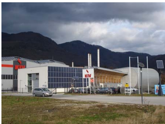
Daljinski sistem ogrevanja na lesno biomaso in sončno energijo na Vranskem

Občina Vranksko je bila v Sloveniji pionir na področju daljinskih sistemov ogrevanja na obnovljive vire energije. Njihov DOLB je začel delovati že leta 2005, gospodinjstvom in velikim porabnikom pa dobavlja toploto preko 134 priključkov. Leta 2012 so ga nadgradili še s toplotnim solarnim sistemom, saj je poletni uporaba lesne biomase zaradi manjše porabe toplote neučinkovita. S tem je oskrba s toploto na Vranskem postala neodvisna od uvoženih fosilnih energentov .