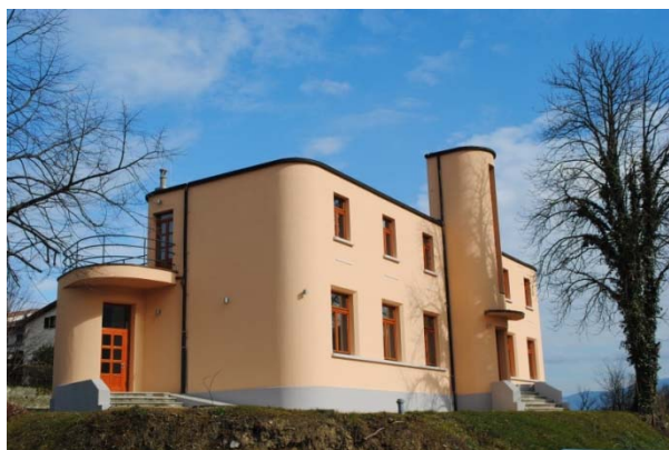
Učni center deluje v prenovljenem objektu osnovne šole v naselju Brje.

Za to, da se razvojni potenciali podeželja pretvorijo v zelena delovna mesta, je ključen dvig vsestranske usposobljenosti pridelovalcev, predelovalcev, rokodelcev, ponudnikov storitev itd. Občina Ajdovščina je z namenom ohranjanja bogate sadjarske in vinogradniške tradicije območja Vipavske doline vzpostavila učni center za predelavo in promocijo kmetijskih pridelkov .