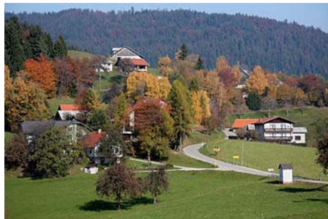
Podeželska krajina, ki jo v Sloveniji pričakujejo obiskovalci – preplet narave in kulturne krajine.

In nenazadnje: različni načini neposredne prodaje in turizem veliko bolj kot drugi prodajni kanali, kot so npr. prehranska industrija in trgovske verige, podeželskim prebivalcem omogočajo višjo stopnjo avtonomije pri določanju cen ter pravičnejše plačilo za njihove proizvode in storitve .