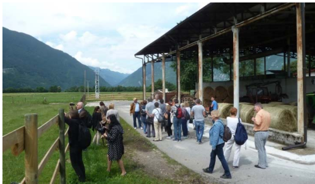
Ogled ekološkega posestva Bogata v Bovcu

sprejeli, nam razkazali posestvo ter odgovorili na naša vprašanja.