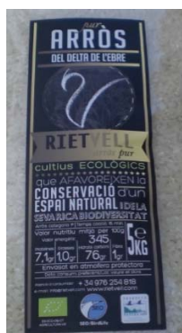
Oznaka Natura 2000 na rižu iz naravnega parka v delti reke Ebro v Španiji

Pod sloganom »Natura 2000 branding – koristi za ljudi, naravo in lokalno gospodarstvo« je Evropska komisija podprla kampanjo za spodbujanje uporabe blagovne znamke Natura 2000 , ki poudarja koristi tega omrežja: spodbuja naravi prijazne proizvode in storitve z območij Natura 2000 ter ozavešča o koristih, ki jih ti zagotavljajo za naravo in ljudi, ki živijo in delajo na zavarovanih območjih. Uporaba znamke Natura 2000 je namenjena doseganju večje prepoznavnosti in dodane vrednosti lokalnih proizvodov in storitev .