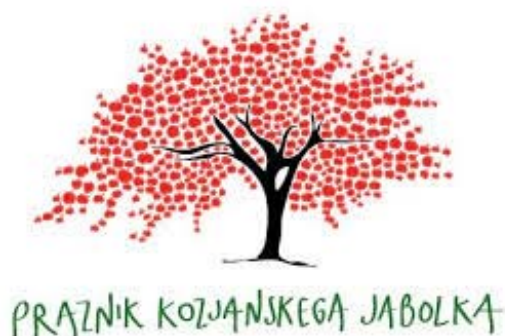
Praznik kozjanskega jabolka – »okoljski sejem z dušo«

jabolka, s katerim želijo prikazati sodelovanje s prebivalci parka in skupna prizadevanja na področju varstva naravnih vrednot in ohranjanja kmetijske kulturne krajine. Njen najbolj značilni element so na Kozjanskem prav visokodebelni travniški sadovnjaki s starimi sortami jablan.